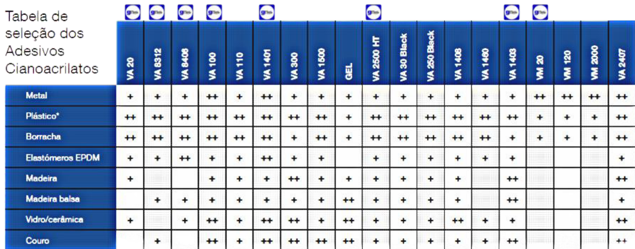
Tabela de seleção dos Adesivos Cianoacrilatos